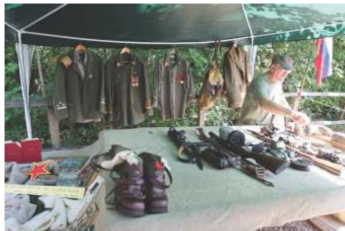
Razstava opreme in orožja