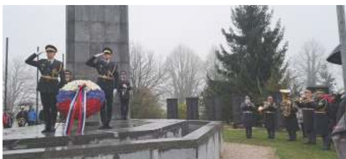
Poklon Slovenske vojske na Cvibljju.

Spomenik pri največji kostnici v Sloveniji je posvečen več kot 2.200 padlim in umrlim partizankam in partizanom, aktivistom OF, internirancem in pripadnikom zavezniških enot iz sedemnajstih držav, ki so pobegnili iz nemške vojske in se priključili slovenskim partizanom. Padli so v bojih na območju Suhe krajine in predvsem v okolici Žužemberka, ki je bil zaradi