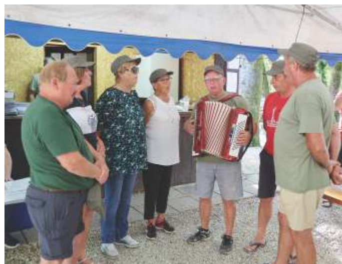
Kulturniška skupina Gorjanske čete