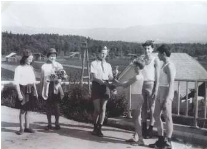
Sprejem Titove štafete v Kronovem od šmarješki pionirjev leta 1963 (hrani: Zgodovinski arhiv Ljubljana, enota za Dolenjsko in Belo krajino, Kronika OŠ Otočec 1962/63).

Štafeta mladosti je potekala na podoben način kot kurirčkova pošta. Na šoli so bili izbrani trije pionirji, ki so nato od točke A do točke B prenesli štafeto in jo predali naslednjim trem pionirjem iz druge šole. Ob sprejemu štafete so pripravili kulturni program. Prihod štafete so prišli pozdravit vsi krajan. Nagovore so imeli politični veljaki, borci so obujali spomine na vojno, igrale so mestne godbe, peli so pesmi, recitali itd.