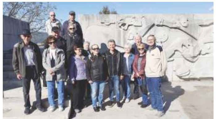
Pri spomeniku NOB na Gričku v Črnomlju