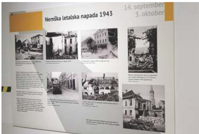
Razstava Moč in nemoč spomenikov

Tudi zaradi zakonske ureditve so bili spomeniki NOB že od leta 1981 dalje del naše dediščine in so se zaradi takšne obravnave na Slovenskem ohranili tudi po letu 1991.