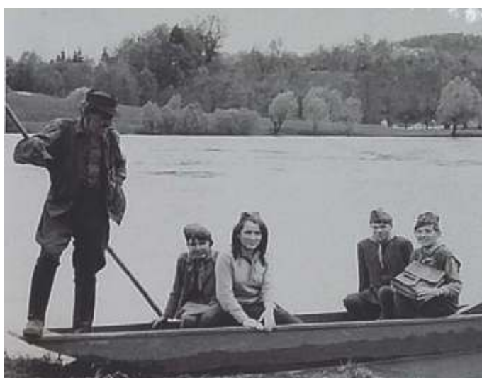
Kurirčkovo pošto so s čolnom prepeljali prek reke Krke.

Torbica je bila usnjena, v njej pa zapisana zaobljuba vseh pionirjev, da bodo stopali po Titovi poti.