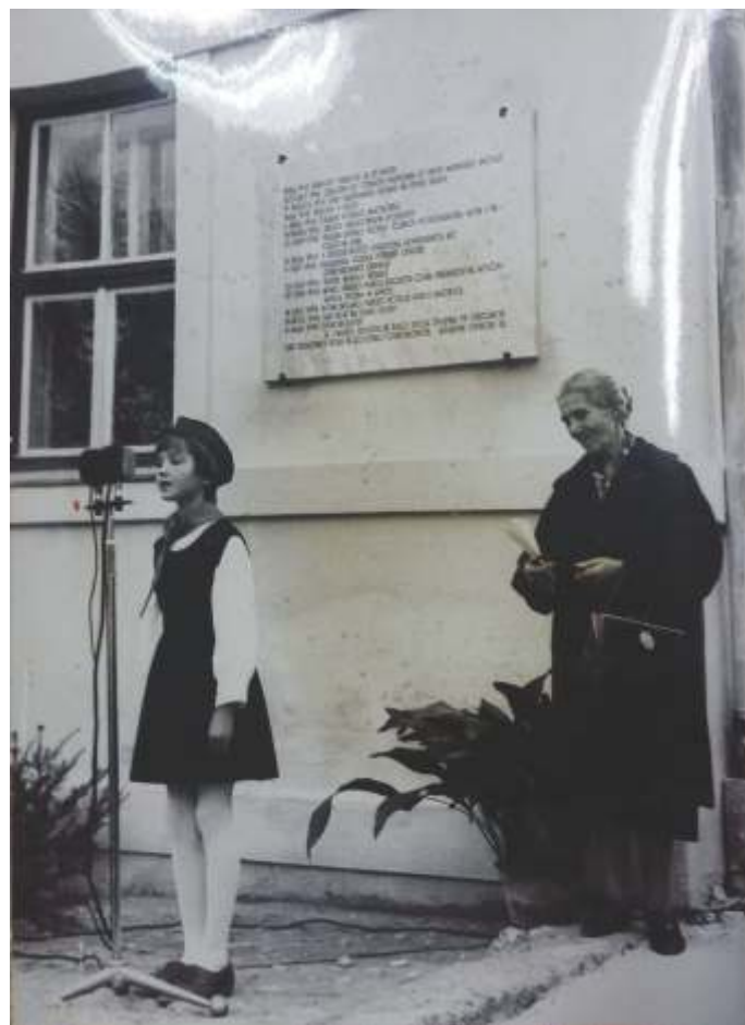
Recitacija učenke ob 100-letnici šole.

Delovanje mladih skozi šolsko leto, lahko strnemo s sestavkom, ki je bil zapisan v kroniki OŠ Otočec: »Na šoli so bili vsi učenci vključeni v pionirsko organizacijo, razen 8. razreda. Cicibani so bili sprejeti v pion. org. 29. nov. Sprejem je bil slovesen. Junija so bili pion. 7. razr. sprejeti v mlad. organizacijo. Tudi ta sprejem so lepo pripravili mladinci in prizadevni pionirji. Pionirji so sodelovali na vseh proslavah. Za praznične dneve so tudi lepo okrasili šolo. Ob štafeti, v kateri so sodelovali, so okrasili tudi pošto in trgovino. Za vse državne praznike so pionirji očistili in okrasili tudi partizanske grobove in spomenike padlim borcem. Uredili so res lepo in jim gre vsa pohvala. Posebno lepo so se pripravili za svoj praznik pionirski dan. Poleg proslave so imeli tudi slavnostno sejo.«