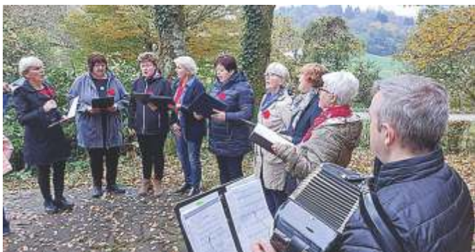
Nastop Kronc na Ruperč Vrhu

V soboto, 26. 10. 2024, je bila v spominskem parku NOB na Ruperč Vrhu slovesnost ob dnevu spomina na mrtve. Pred tem smo uredili spominski park in s cvetjem okrasili grobišče dvanajstih partizanov.