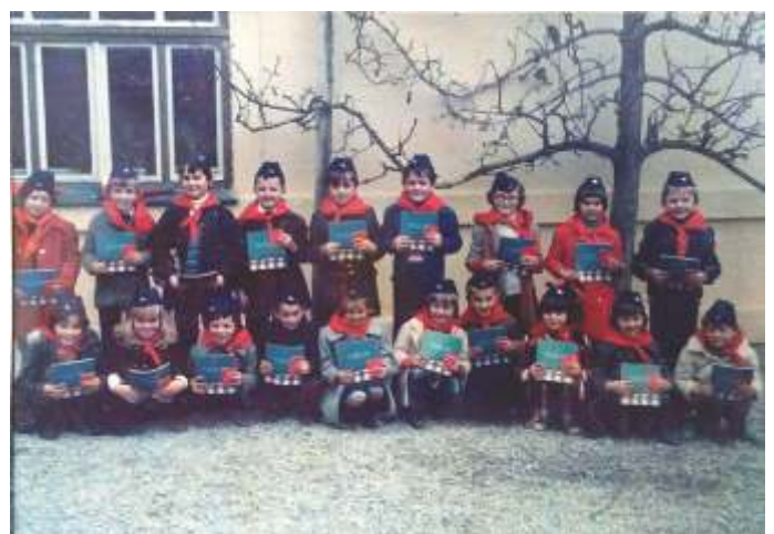
Cicibani, sprejeti v Pionirsko zvezo na dan republike, na sliki pionirji s pionirskimi simboli.

Cicibani (ime je prevzeto iz otroških pesmi Otona Župančiča) so bili sprejeti med pionirje 29. novembra, ki so ga leta 1962 razglasili tudi za dan pionirjev. V zvezo so bili sicer sprejeti na dan republike, vendar pa je moral biti to strogo ločen dogodek, saj so poudarjali pomembnost sprejetja v pionirske vrste in so želeli, da se otroci pri sprejemu v Zvezo pionirjev čutijo posebne. Dan republike so za sprejem cicibanov v Pionirsko organizacijo sprejeli zaradi njegove simbolike: simboliziral je rojstvo nove družbene ureditve, ki je prinesla možnost za lepše in srečnejše življenje vseh, še posebej mladih, prihajajočih generacij. Dvorana, v kateri je potekal sprejem, je bila nujno opremljena z veliko sliko tovariša Tita s pionirji, s fotografijami ali risbami raznih pionirskih dejavnosti, kak pomemben izrek, zastave in pionirske zastavice, cvetje itd.