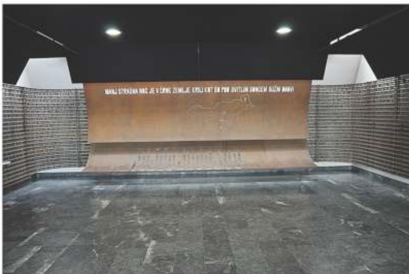
Razstava Moč in nemoč spomenikov – vhod v Dolenjski muzej