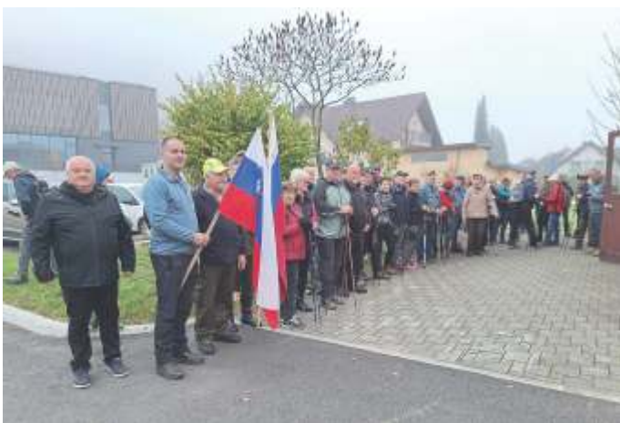
Zbor pohodnikov v Škocjanu