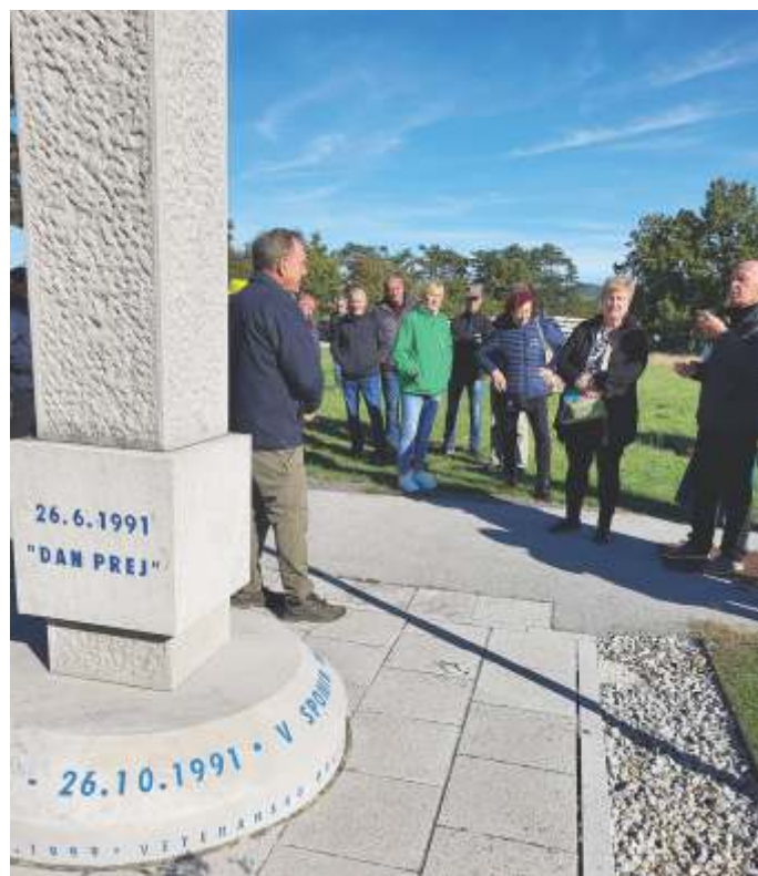
Pri spominskem obeležju v Divači

V Primorskem muzeju smo se pod vodstvom kustosinje seznanili z zgodovino slovenske protifašistične organizacije TIGR, ki je na