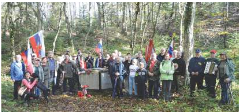
Pohodniki pri grobišču

in miren počitek nasilno umrlim. Žrtve so bile večina mladi ljudje, ki so želeli prispevati v boju za zmago nad okupatorji domovine.