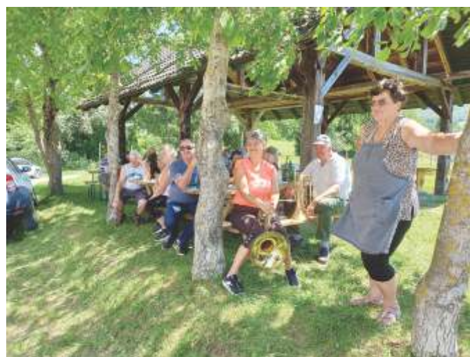
Po pohodu se prileže počitek.