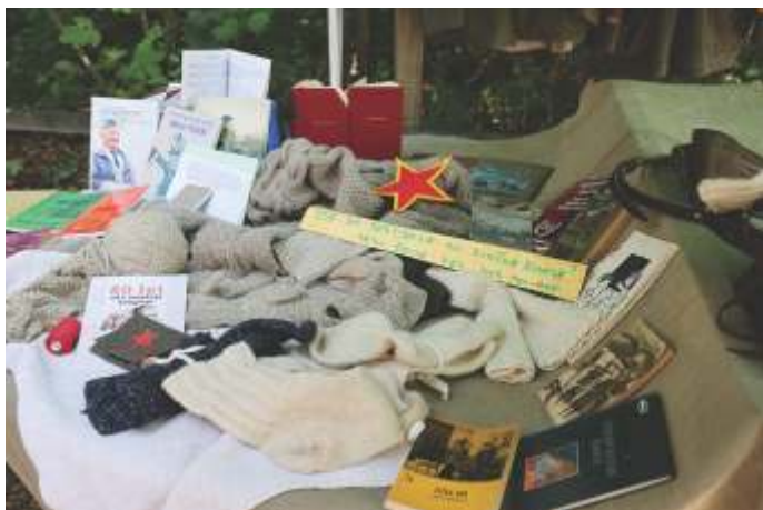
Razstava literature o NOB