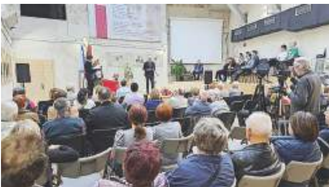
Lirika upora 2024

»Veste, današnji večer je bil res en sam užitek gledati in ne samo poslušati! Redkokdaj doživiš tako lep primer sodelovanja generacij: od osnovnošolke iz četrtega razreda in študenta do predstavnikov starejše generacije. In partizanska lirika. Imenitno!«