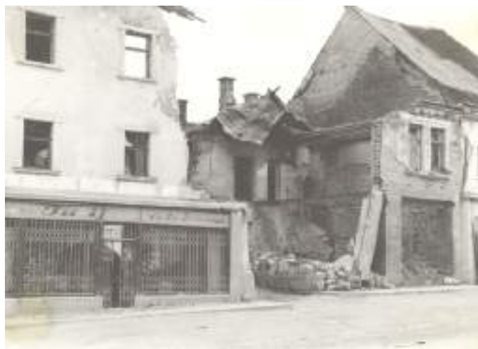
Ruševine Koširjeve hiše (danes Glavni trg 25), 1944.

Novo mesto in bližnja okolico je med drugo svetovno vojno doletelo vsaj sedemnajstkratno bombardiranje, obstreljevanje in raketiranje, tako nemškega, zavezniškega in partizanskega letalstva. Najhujši so bili trije nemški letalski napadi, z največ žrtvami v samem mestu in veliko materialno škodo. Pri teh napadih je trpelo predvsem središče mesta. Aprilski napad 1941 je uničil poslopje današnje Osnovne šole Center, 14. septembra 1943 so med predirljivim tuljenjem nemške štuke odvrogle bombe predvsem na območje med žensko bolnišnico (danes Defranceschijeva ulica 1) in hotelom Koklič (današnja Rozmanova ulica), 3. oktobra 1943 pa je bilo pravo razdejanje na širšem območju pod Kapitljem v smeri glavne novomeške ulice.