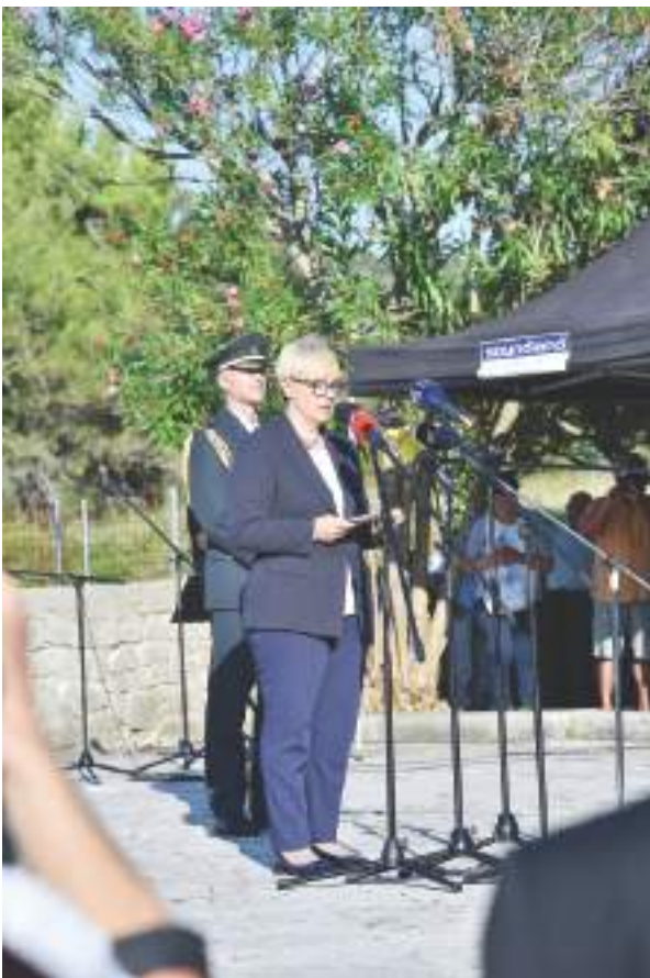
Zbrane je nagovorila predsednica Republike Slovenije Nataša Pirc Musar.