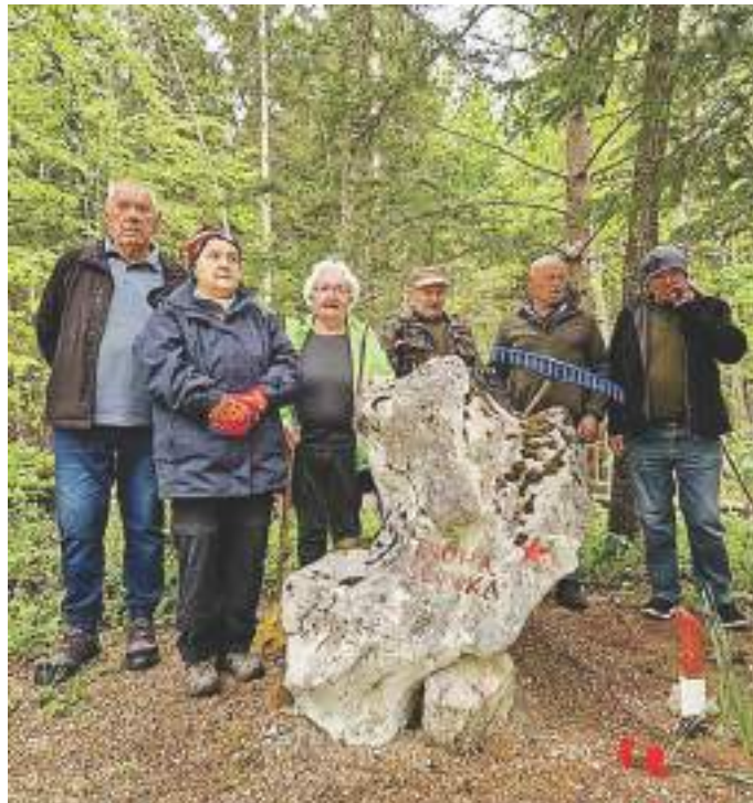
Čiščenje partizanskih grobišč v Rogu

Tovariško srečanje z malico je sledilo pri polharski