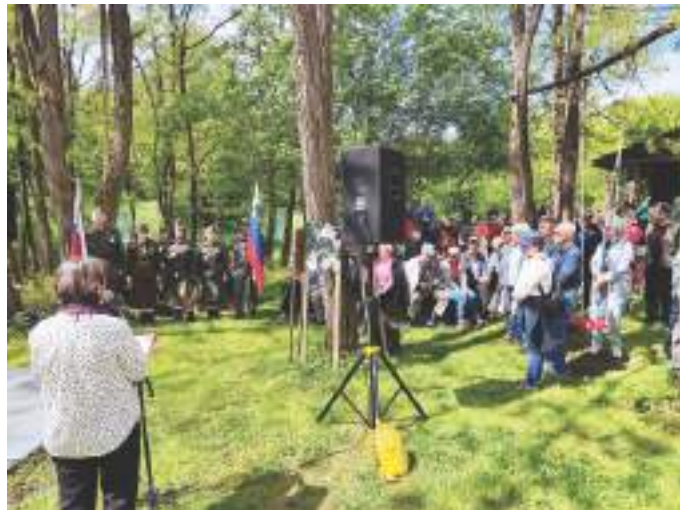
Pohod se je zaključil s prireditvijo na Pumpnci