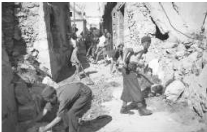
Po vojni so Novomeščani, tudi mladina, pospravljali ruševine z udarniškim delom, 3. junij 1945.