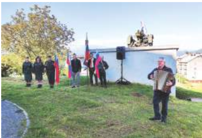
Pohod Novo mesto v žici se je začel na Drski s pesmijo.

navdih za mnoga osvobodilna gibanja v Evropi. Tokratni pohod ni minil samo kot spomin na leta vojne in okupacije, temveč so organizatorji v Združenju borcev za vrednote NOB Novo mesto poudarili prizadevanje za mir in končanje vojn, ki tudi danes še vedno pojavljajo v Palestini, Ukrajini in drugod. Svoboda in mir žal še vedno nista samoumevna za vse prebivalce našega skupnega sveta.