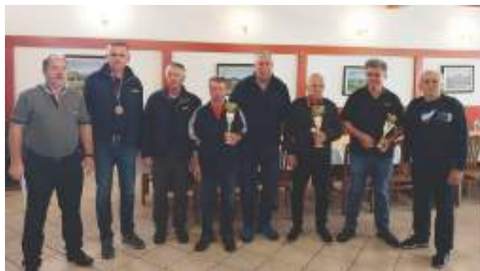
Najboljši strelci na tekmovanju ob dnevu zmage

Tretje tekmovanje, ki ga je organiziralo Združenje, je potekalo na strelišču strelskega društva Gorjanci v Novem mestu. Prvo mesto je s 511 točkami osvojila ekipa Združenja borcev za vrednote NOB Novo mesto. Druga je bila ekipa Območnega združenja slovenskih častnikov Novo mesto s 504 točkami, tretje mesto pa je s 495 točkami osvojilo