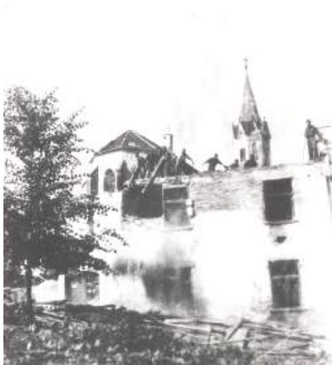
Rušenje hiše v nekdanji Arkovi ulici (danes Prešernov trg), 1945.

pustil neizbrisan pečat pri obnovi mesta. Letos mineva 120-letnica njegovega rojstva.