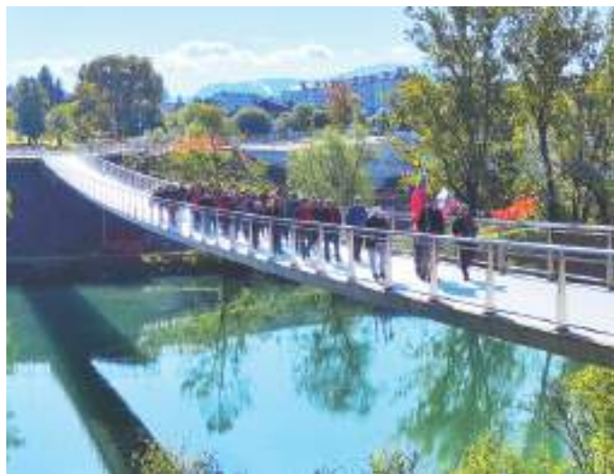
Po Štukljevi brvi