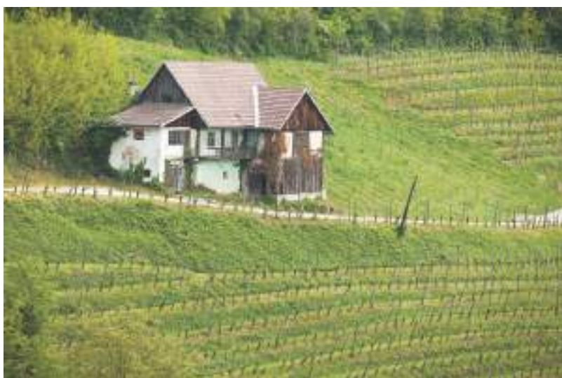
Pogled na nekdanjo Kozinovo zidanico na Trški gori.

Novo mesto se je velikemu skladatelju poklonilo z odkritjem spominskega obeležja na njegovi rojstni hiši in s spomenikom v parku Knjižnice Mirana Jarca. Od leta 1971 se po njem imenuje novomeška glasbena šola, v kateri je tudi dvorana Marjana Kozine in njegov doprski kip. Leto prej je bila imenovana Ulica Marjana Kozine. Družinska