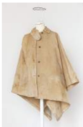
Pelerina Marjana Kozine, platno, 1943–1945. Hrani: Dolenjski muzej Novo mesto.