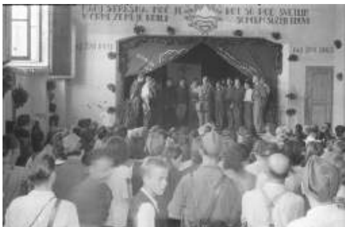
Nastop Invalidskega pevskega zbora v Črnomlju.

narodnoosvobodilnim bojem okoli petdeset skladateljev partizanov ustvarilo več kot tristo zborovskih skladb. Nekateri od njih so z vodenjem pevskega zbora vse do dandanašnjih dni uspešno ohranjali glasbeno dediščino pesmi upora. In ne le to, številni od njih so se s svojim glasbenim ustvarjanjem med vojno in po njej trajno zapisali v zakladnico raznovrstnega slovenskega glasbenega ustvarjanja.