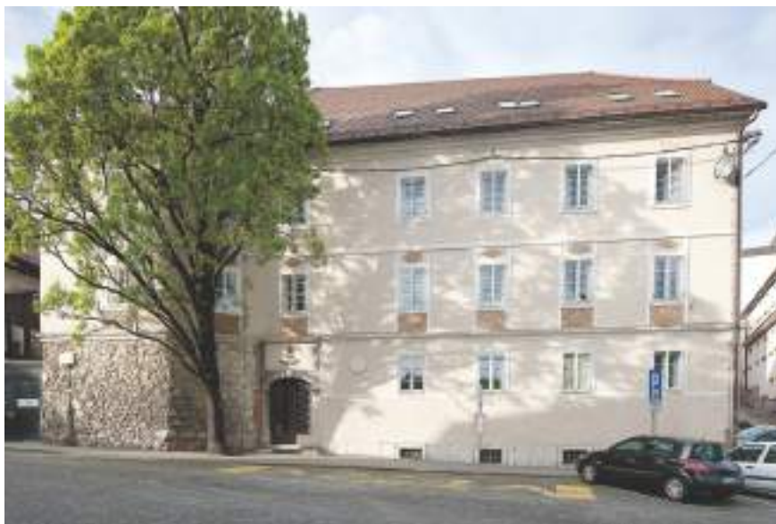
Pogled na rojstno hišo Marjana Kozine.

Veliko časa je preživel v družinski zidanici na Trški gori, v kateri je imel svojo sobo s klavirjem, kjer je ustvarjal. Umrl je 19. junija 1966 v Novem mestu, kjer je pokopan na pokopališču v Ločni.