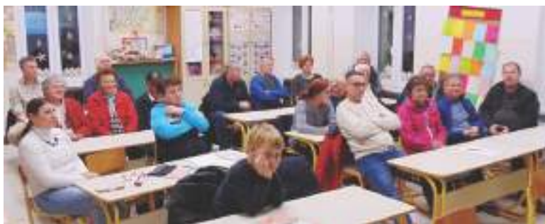
Zbor članov v Birčni vasi