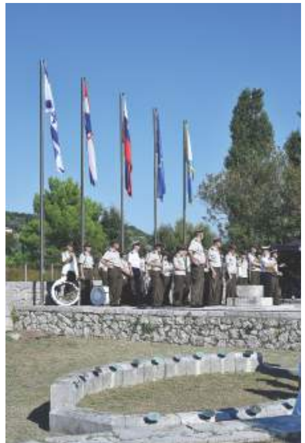
Na slovesnosti je nastopal orkester hrvaške vojske.