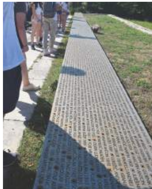
V italijanskem koncentracijskem taborišču na Rabu je izgubilo življenje veliko Dolenjcev in Belokranjcev.

9. septembra 2023, ob 80-letnici osvoboditve taborišča, se je 48 udeležencev Združenja borcev za vrednote NOB Novo mesto pridružilo 1000 drugim na slovesnosti pri spomeniku na taboriščnem pokopališču. Dogodek, ki je bil spominsko in tesnobno obarvan, nas je prevzel z