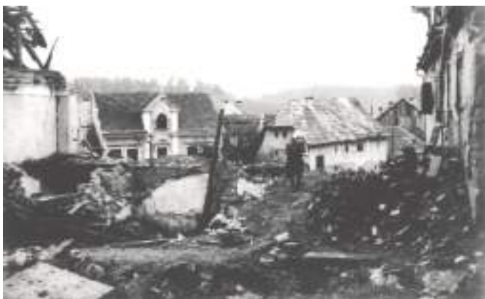
Razdejanje v Arkovi ulici in delu Florijanovega trga (danes Prešernov trg), 3. oktober 1943.