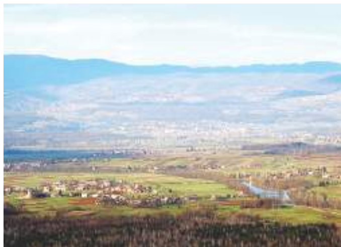
Griblje.