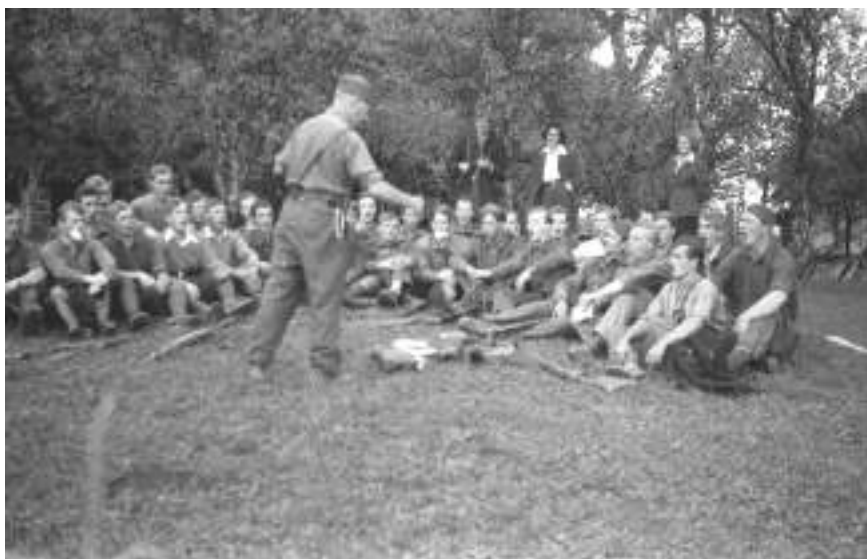
Vaje pojoče čete v Sadinji vasi. Fotografijo hrani Muzej novejšje zgodovine v Ljubljani.