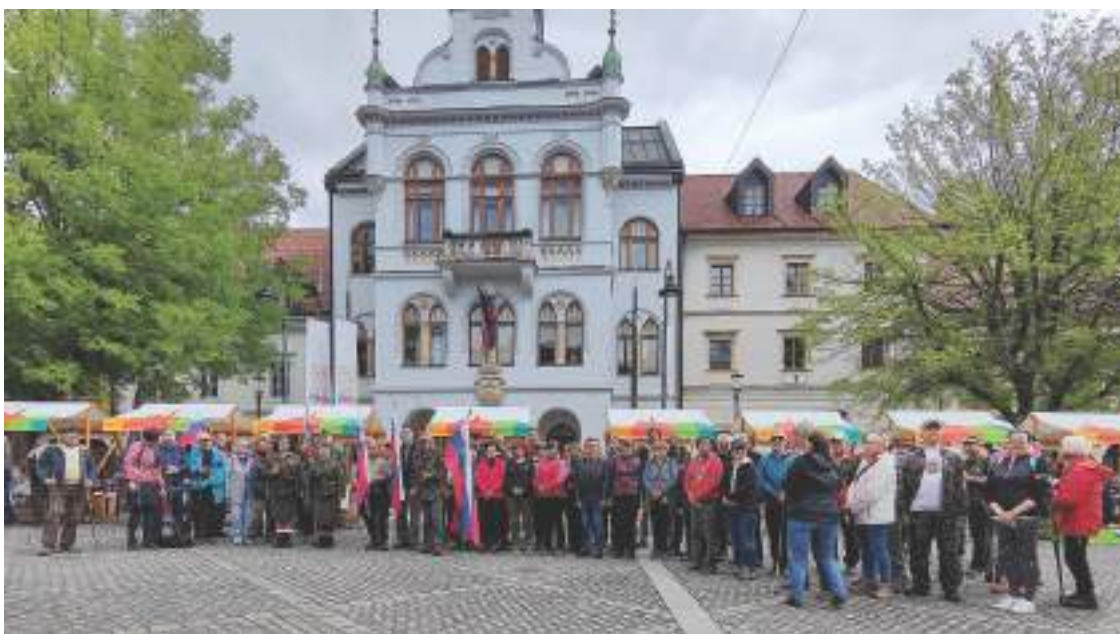
Pohodniki so tudi letos napolnili Glavni trg.